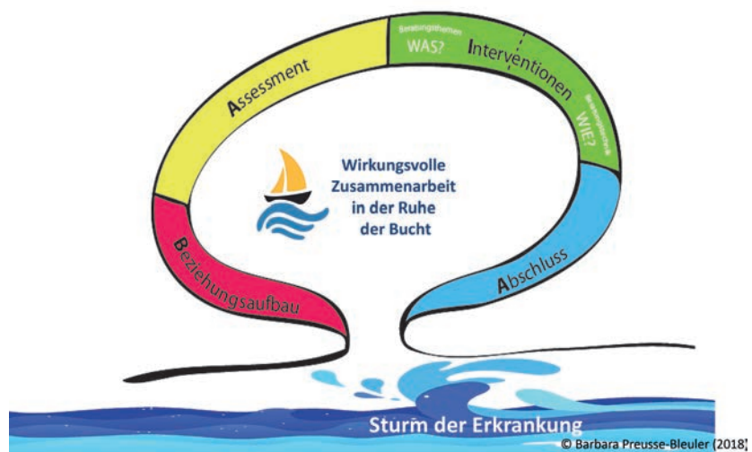
BAIA – eine wirkungsvolle Zusammenarbeit (eigene Grafik Barbara Preusse)